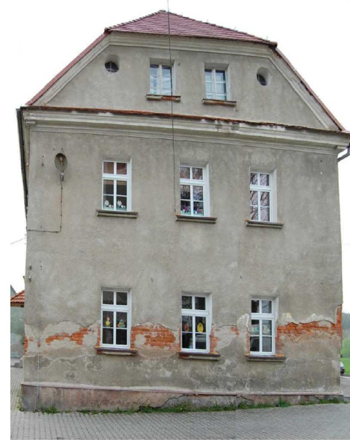
Elewacja boczna (zachodnia)