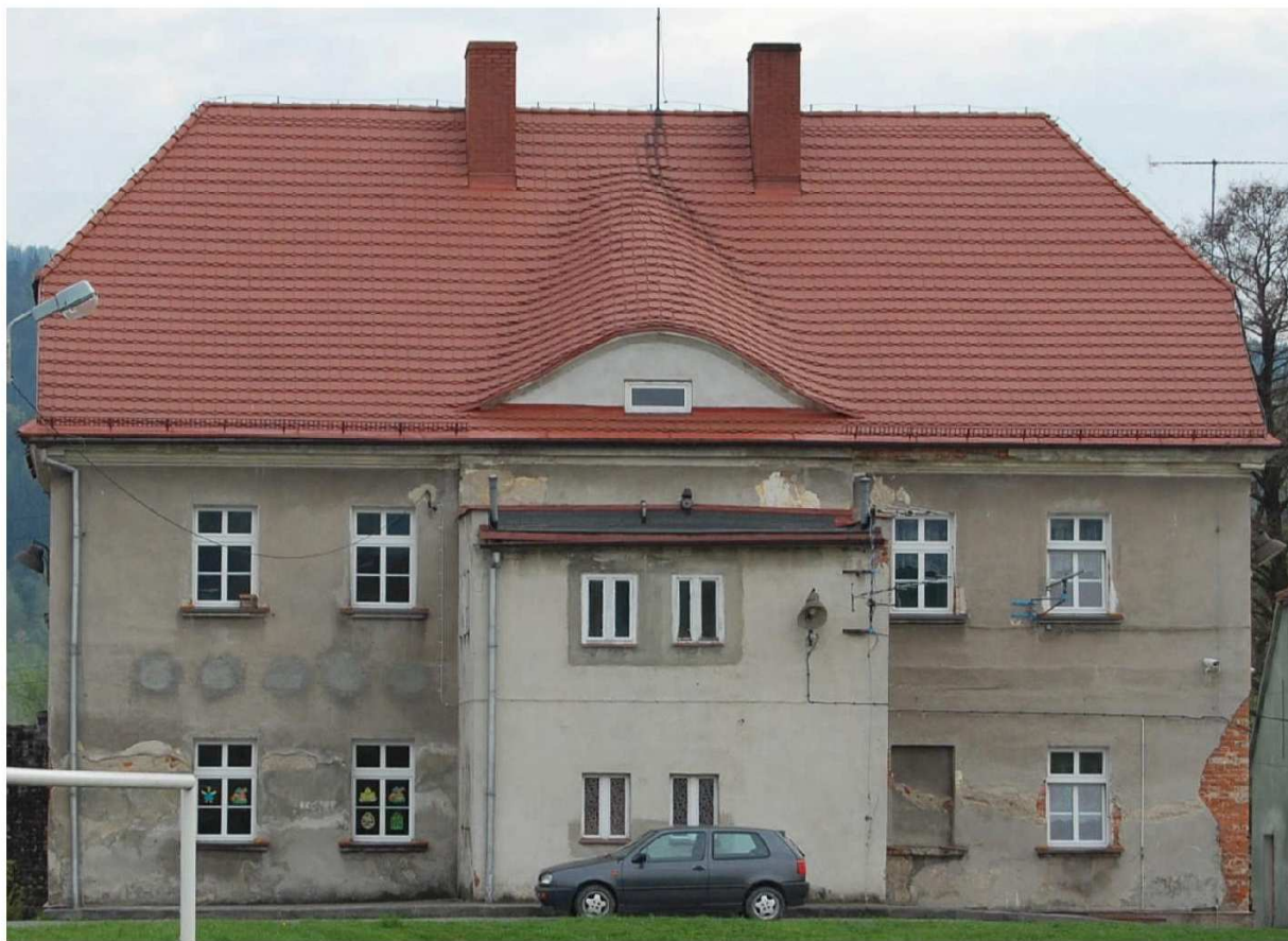
Elewacja tylna (południowa)