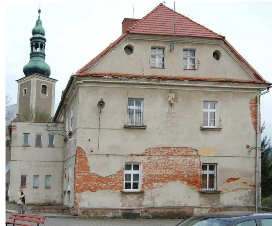
Elewacja boczna (wschodnia)