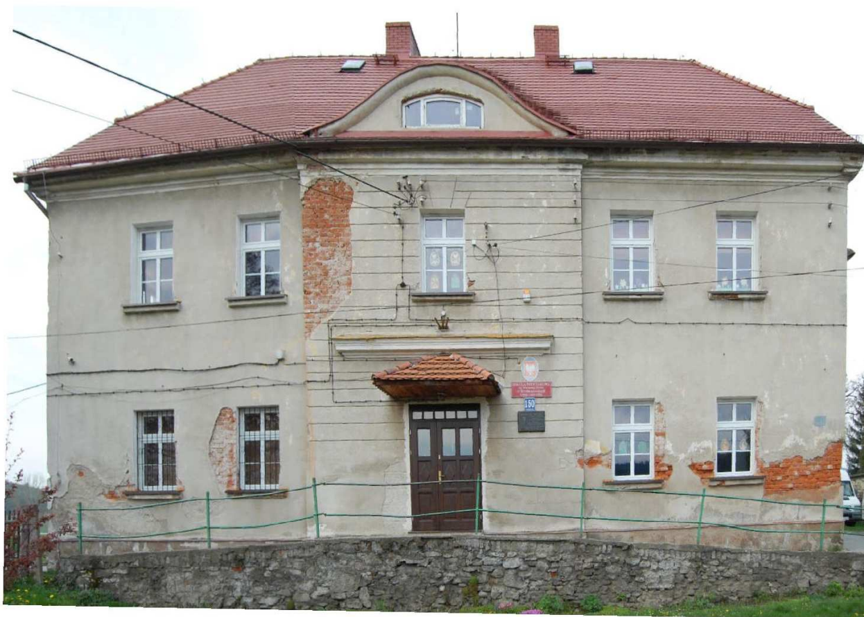
Elewacja frontowa (północna)