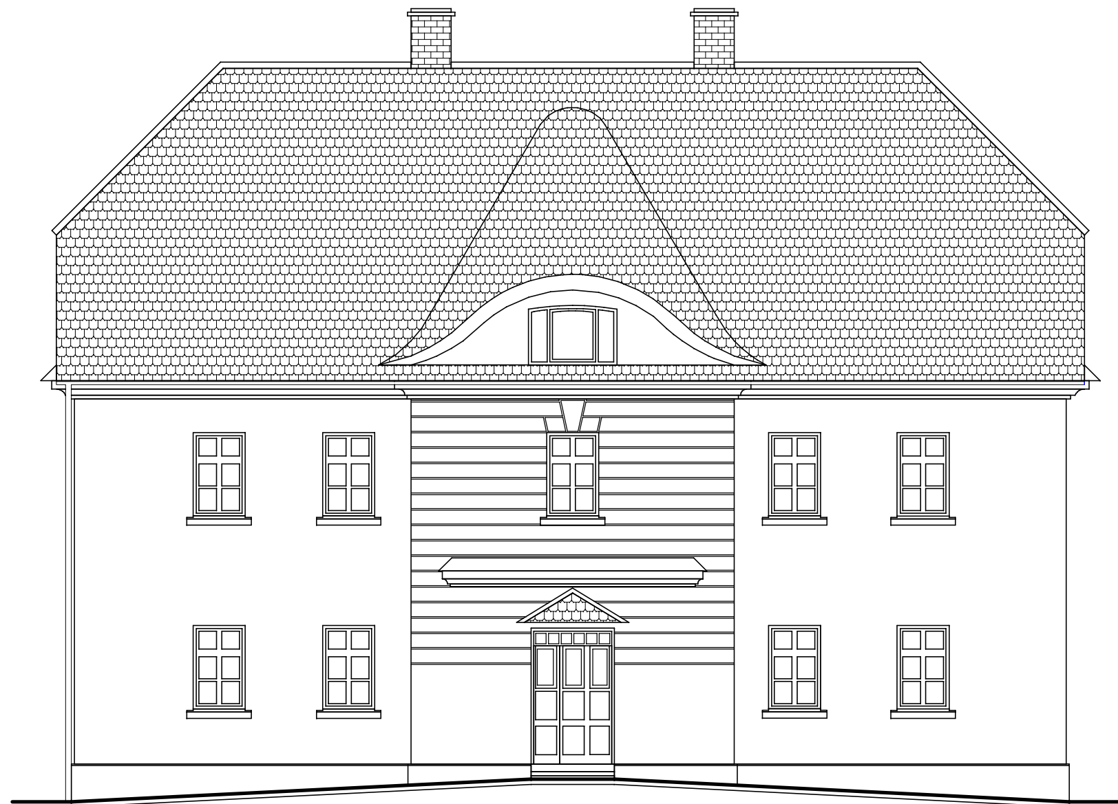
Elewacja frontowa (północna)