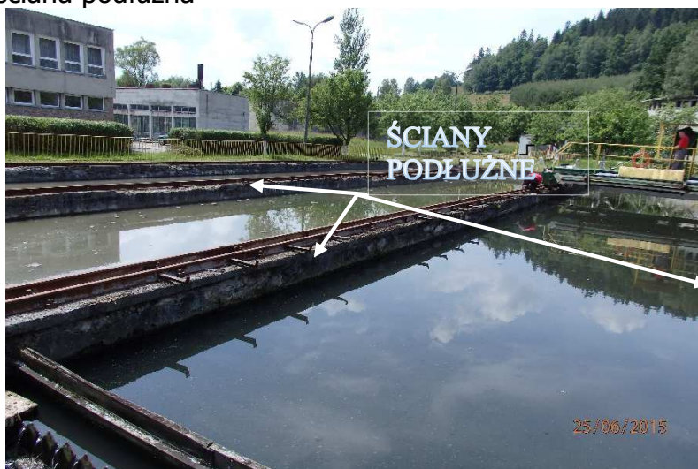
Zdj. Nr 1 ściana podłużna

Naprawie podlegać mają ściany podłużne gr. 40 cm oraz ściana poprzeczna gr 15 cm od strony tzw. Rozjazdu urządzenia zgarniającego patrz zdjęcia nr 1, 2, 3