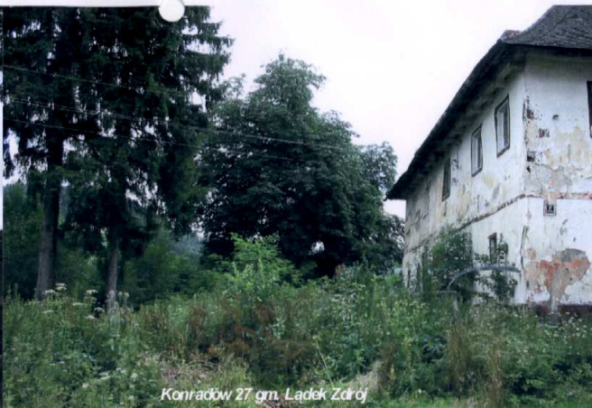
Konradów 27 gm. Łądek Zdrój