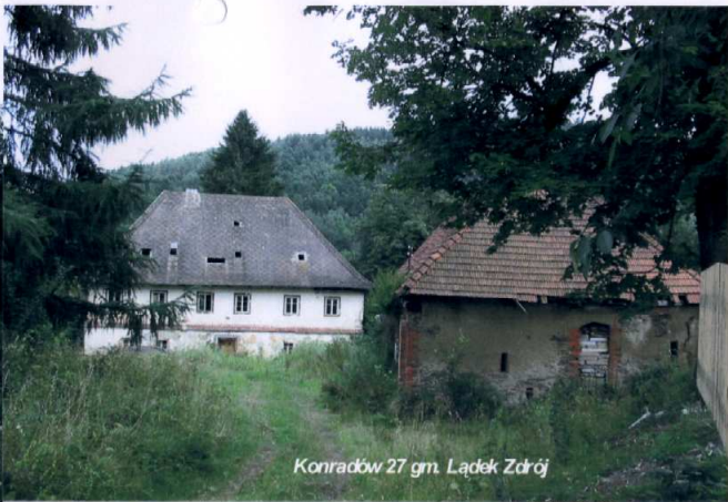
Konradów 27 gm. Łądek Zdrój