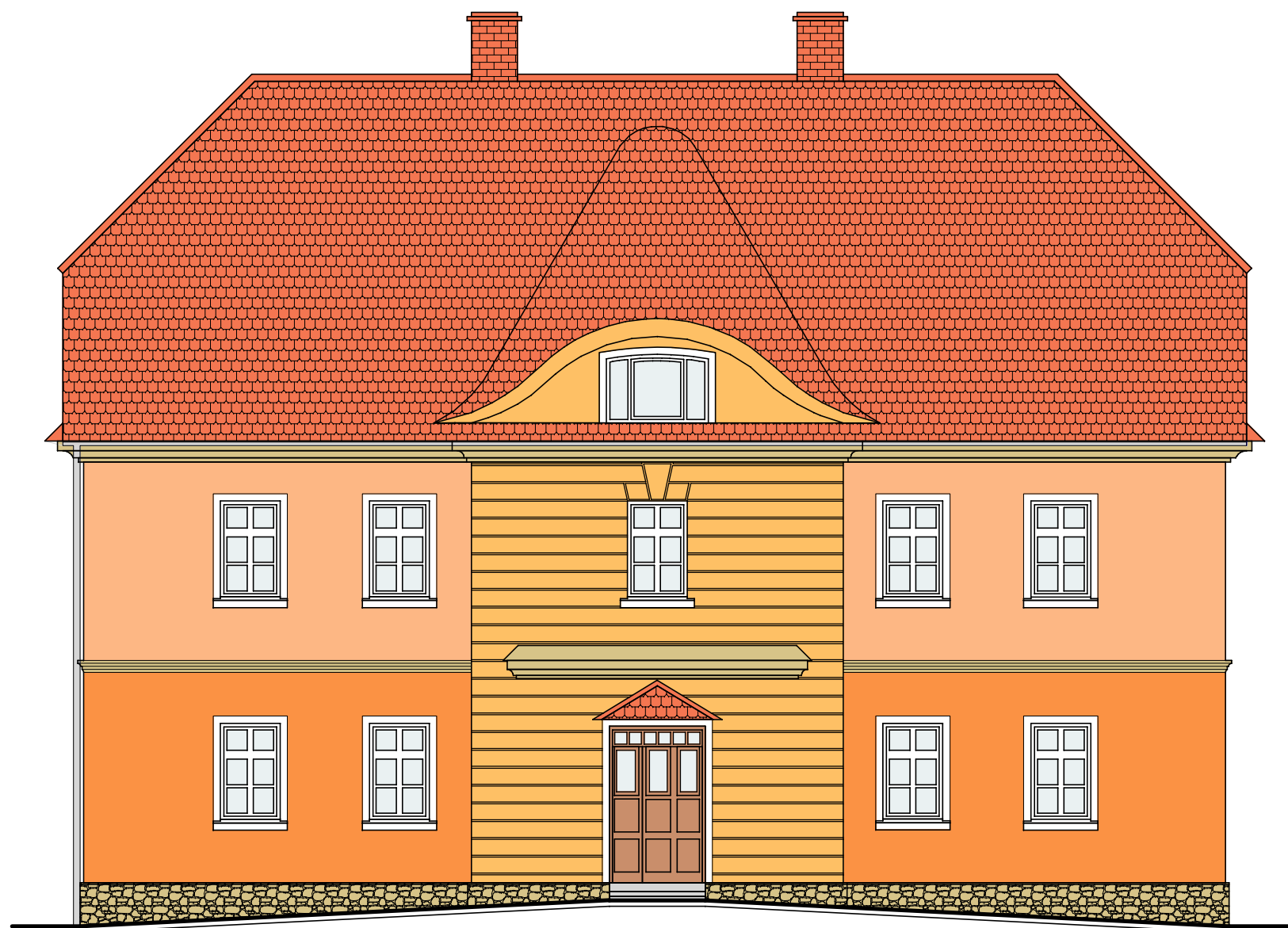
Elewacja frontowa (północna)