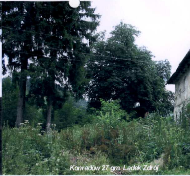
Konradów 27 gm. Łądek Zdrój