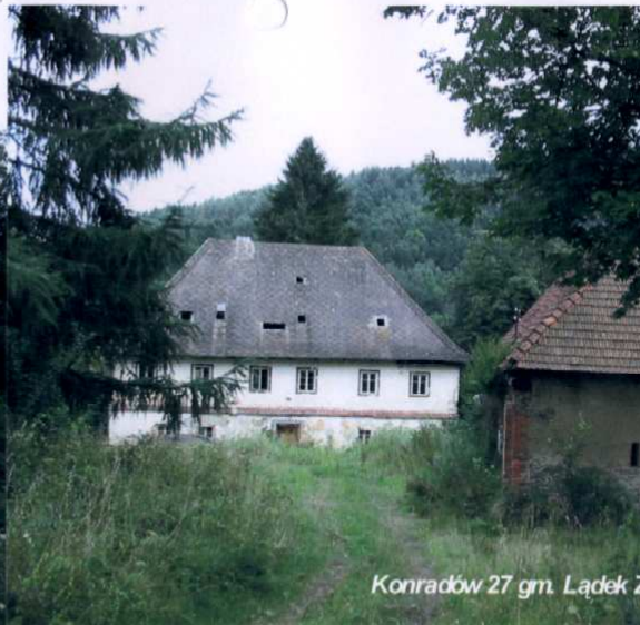
Konradów 27 gm. Łądek 2