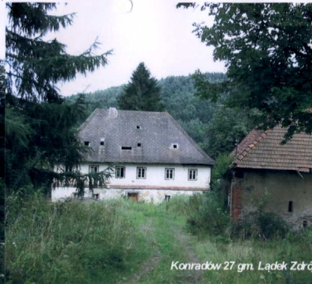
Konradów 27 gm. Łądek Zdró