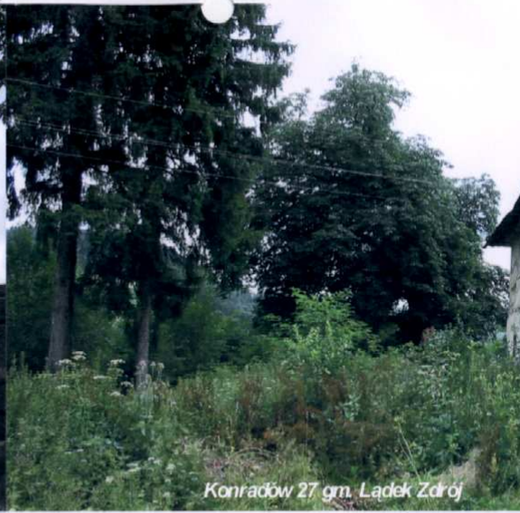
Konradów 27 gm. Łądek Zdrój