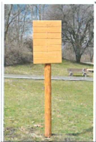
tablica 2.jpg 255K