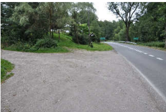
Początek przebudowywanej drogi

Droga gminna o cząstkowej nawierzchni bitumicznej szerokości 3,5-4,0m. Obustronne poprzeraśnięte pobocza. Rów prawostronny zamulony i poprzeraśnięty licznymi krzakami.